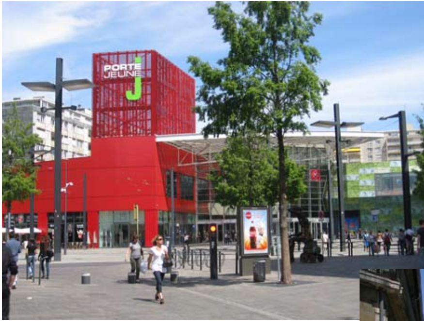
La Porte Jeune, Mulhouse