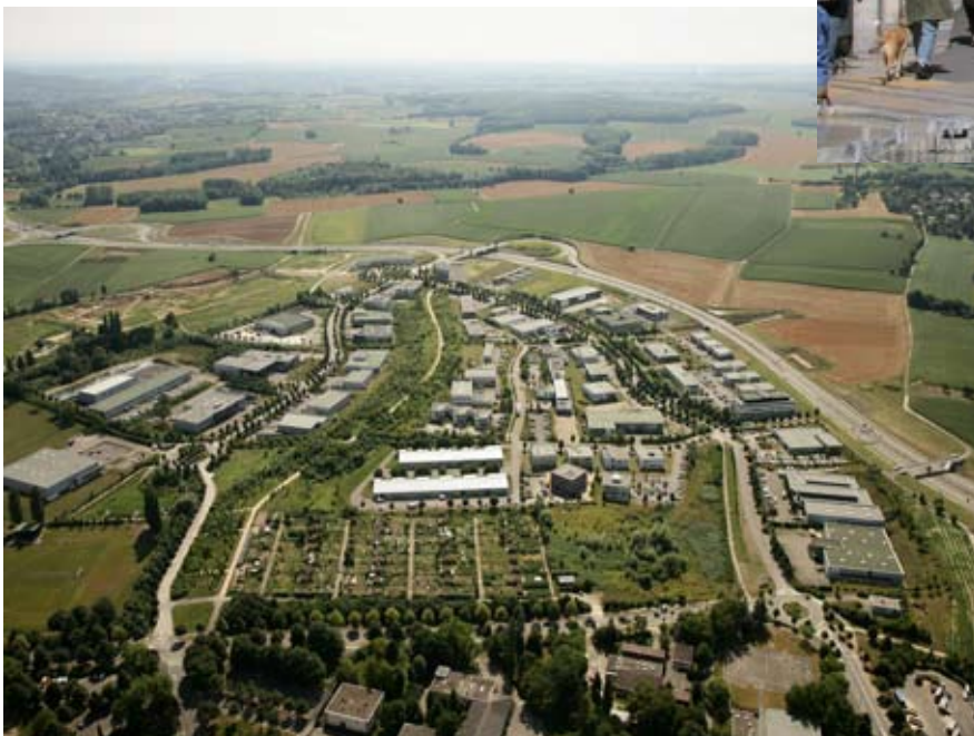
Zone d'activités : Le parc des collines à Mulhouse