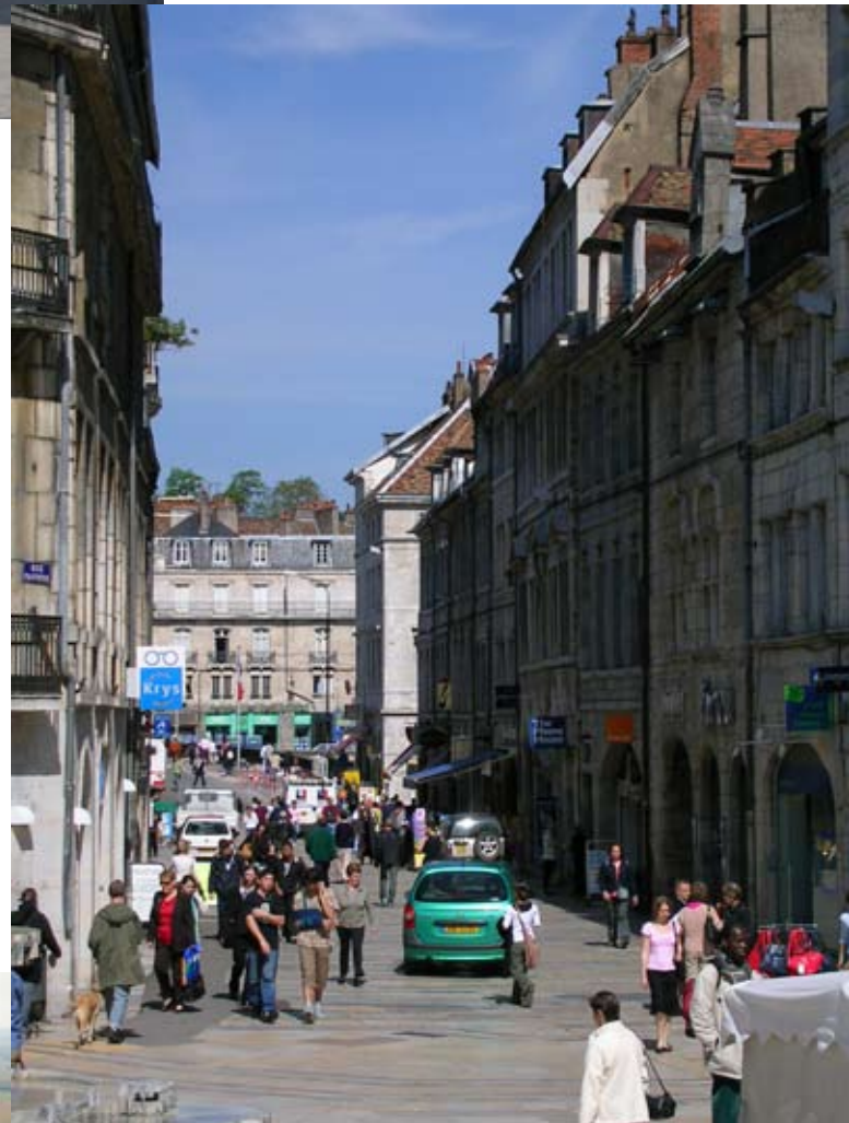
La Grand'rue à Besançon