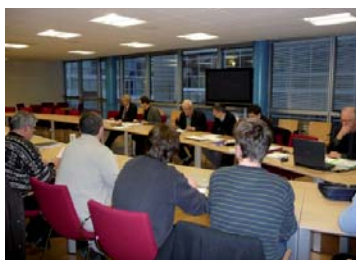
Réunion du bureau du SMSCoT en février 2009

Le comité syndical conduit par son Président, est composé de 66 délégués désignés par les six membres du SMSCoT. Il a la responsabilité de l'élaboration du SCoT et se réunit régulièrement (5 réunions en 2007 et 6 réunions en 2008).