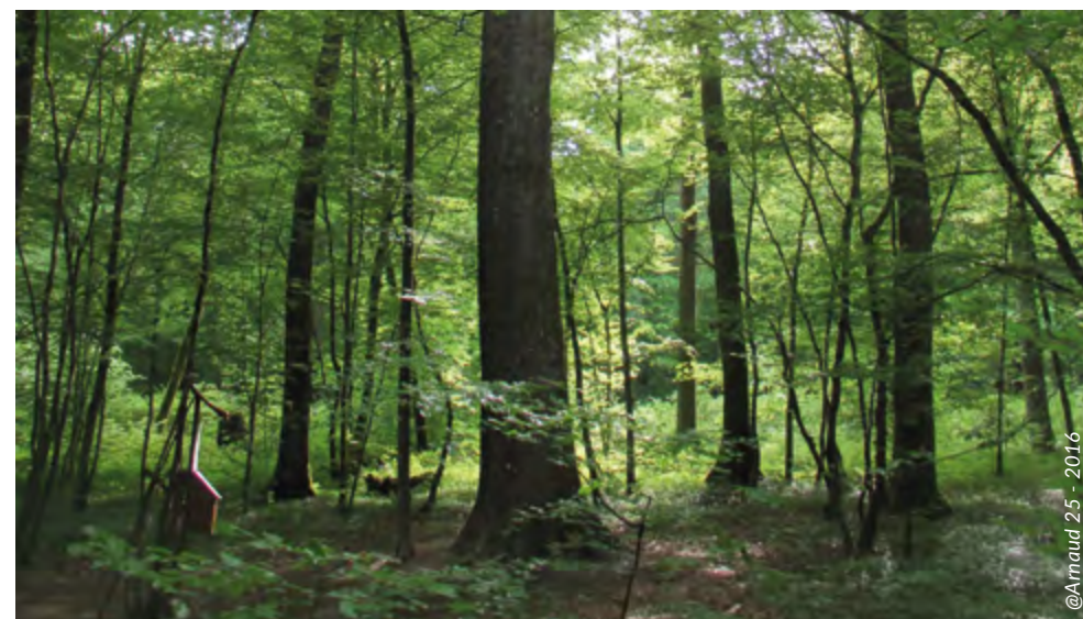
Forêt de Chaux.

Clé de lecture Les particules en suspension PM10 sont des particules dont le diamètre est inférieur à 10 micromètres (poussières inhalables). Une partie des poussières en suspension, qui se trouvent dans l'air, est d'origine naturelle : sable du Sahara, embrun marin, pollens, etc. S'y ajoutent les poussières d'origines anthropiques, émises notamment par les installations de combustion (chauffage), les transports (moteurs diesels), les activités industrielles (construction, secteur minier), l'érosion de la chaussée, etc. Selon l'OMS, une exposition chronique ne doit pas dépasser la concentration annuelle moyenne de 20 \mu\text{g}/\text{m}^3 pour les particules PM10.